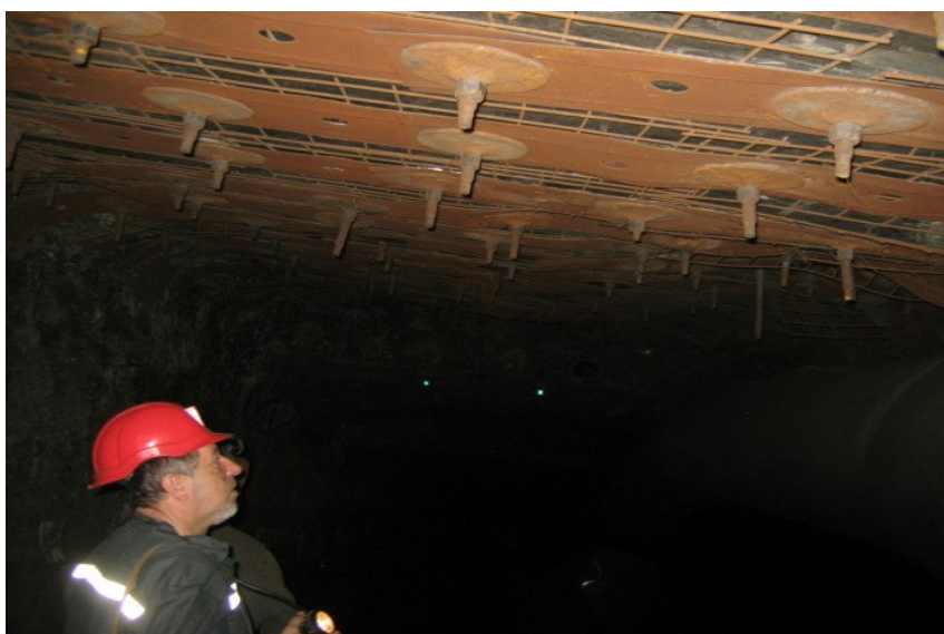
Рисунок 5 - Стан середньої частини ділянки виробки, закріпленої за українською технологією анкерними штангами номінального діаметра 25 мм із попереднім натягом 5 т

- на ділянці, закріпленій анкерами номінального діаметра 22 мм за українською технологією і слабким попереднім навантаженням (див. рис. 6), зсуви порід покрівлі виробки перебувають у межах від 100 мм до 500 мм;