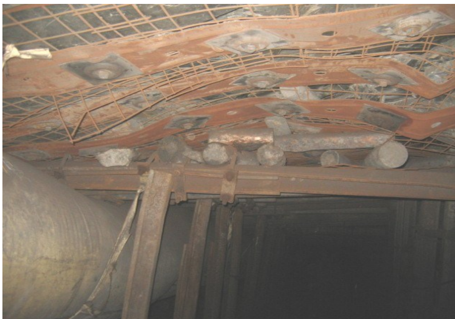
Рисунок 2 - Стан початкової ділянки виробки, закріпленої за американською технологією з номінальним діаметром анкерної штанги 19 мм

кріпилася з використанням АК за технологією американських фірм, тобто без попереднього навантаження, втратила стійкість вже на етапі її зведення. Стан виробки не дозволяв її експлуатацію і вона підлягала повному перекріпленню. У ході експерименту вдалося встановити вплив двох рівнів попереднього навантаження. Так ділянка виробки була закріплена АКМ, виконаним за українською технологією, тобто анкерами номінального діаметра 25 мм і попереднім навантаженням 5 т (див. рис. 5), а інша ділянка – АК номінального діаметра 22 мм зі слабким попереднім навантаженням (рис. 6). Слабкість і невизначеність величини попереднього навантаження викликана відсутністю різьбової ділянки анкерної штанги. Попереднє навантаження здійснювалось за рахунок руху гайки по зовнішній гвинтовій навивці, кут підйому якої складав майже 9^\circ і не дозволив забезпечити необхідний рівень навантаження. Крім того, проблема попереднього навантаження ускладнювалась наявністю вільного допуску у пари «лита гайка – анкерна штанга».