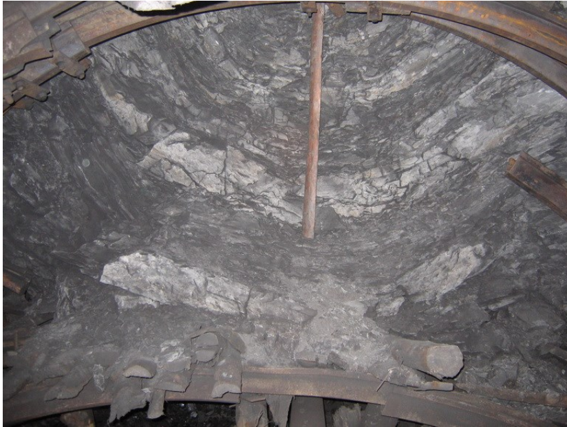
Рисунок 7 - Деформація контуру виробки конвеєрного штреку ш. Лутугінська ДП «Луганськвугілля»

Шари порід, окрім рухів у напрямку виробки, отримують змогу переміщуватись один відносно одного у різних напрямках, про що свідчить форма анкерних штанг, виявлених після обрушення покрівлі виробки. Для усунення явищ зсувів шарів покрівлі у виробку та порушення суцільності порід гірничу виробку закріплюють.