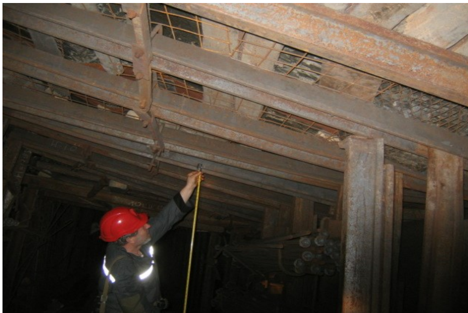
Рисунок 3 - Стан середньої частини ділянки виробки, закріпленої за американською технологією