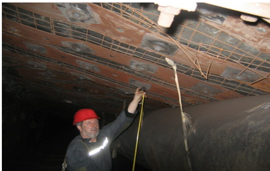
Рисунок 4 - Стан прикінцевої ділянки виробки, закріпленої за американською технологією

Аналіз результатів обстеження виробки показав: