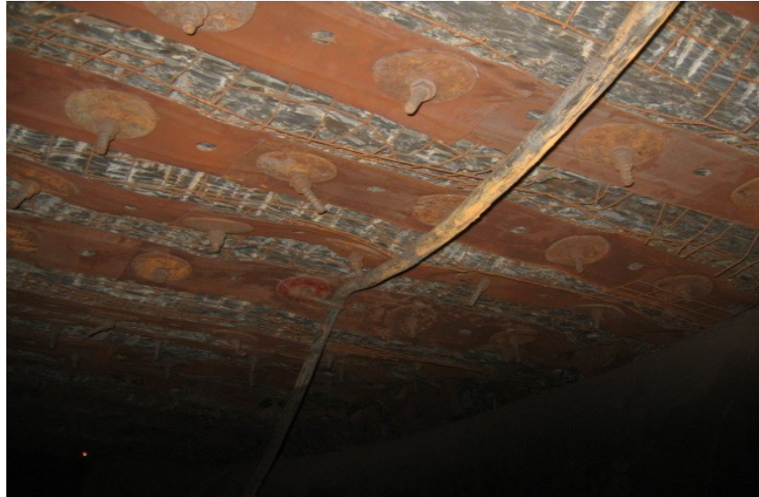
Рисунок 6 - Стан прикінцевої частини ділянки виробки, закріпленої за українською технологією анкерними штангами номінального діаметра 22 мм за наявності попереднього натягу

Випробування ефективності застосування анкерів номінального діаметра 19 мм по технології США в умовах 1-го «біс» конвеєрного штреку пласту l_6 горизонту 725 м ДВАТ «Шахта Білоріченська» показали, що їх використання не забезпечило монолітність порід покрівлі виробки вже на етапі її зведення. Ведення прохідницьких робіт без проведення повного перекріплення виробки неможливо. Основними причинами такого стану виробки, за визнанням керівника проведення експерименту із визначенням ефективності запропонованої технології, проф. К. Анрага (США), і цю думку розділила більшість присутніх на нараді фахівців, явилися інтенсивні процеси зрушення шарів по чисельним площинам ковзання. На думку фахівців ІГТМ НАН України, такий процес може мати місце лише у випадку недостатньої жорсткості конструкції анкерного кріплення в поперечному напрямку.