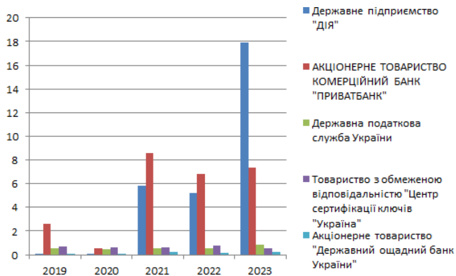
Рисунок 2 – Кількість (млн) сформованих кваліфікованих сертифікатів електронного підпису у п'ятірки найбільших надавачів електронних довірчих послуг.

Найбільшими надавачами електронних довірчих послуг є: Державне підприємство “ДІЯ”, Акціонерне товариство комерційний банк “Приватбанк”, Державна податкова служба України, Товариство з обмеженою відповідальністю "Центр сертифікації ключів "Україна", Акціонерне товариство “Державний ощадний банк України”. На рис.2 приведено діаграму порівняння кількості сформованих кваліфікованих сертифікатів електронного підпису за звітні періоди 2019-2023р. [4].